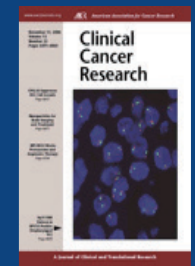
Clin Cancer Res, Nov 2006, Vol 12, Issue 22