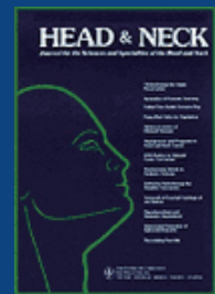
Head & Neck Jan 2007 Vol 29, Issue 1