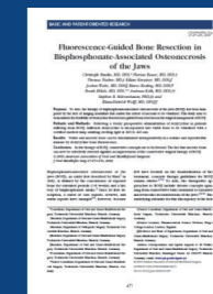
J Oral Maxillofac Surg 67:471-476, 2009