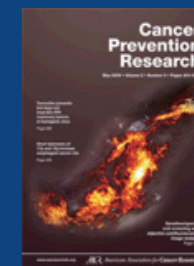
Cancer Prev Res 2009;2(5) May 2009