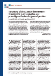
General Dentistry Jan/Feb 2009