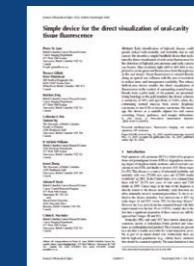
J. Biomed. Opt. 11 (2) Mar/Apr 2006