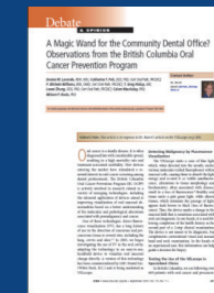
JCDA Sept 2007, Vol. 73, No. 7