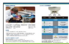
クイックガイド(日本語版)